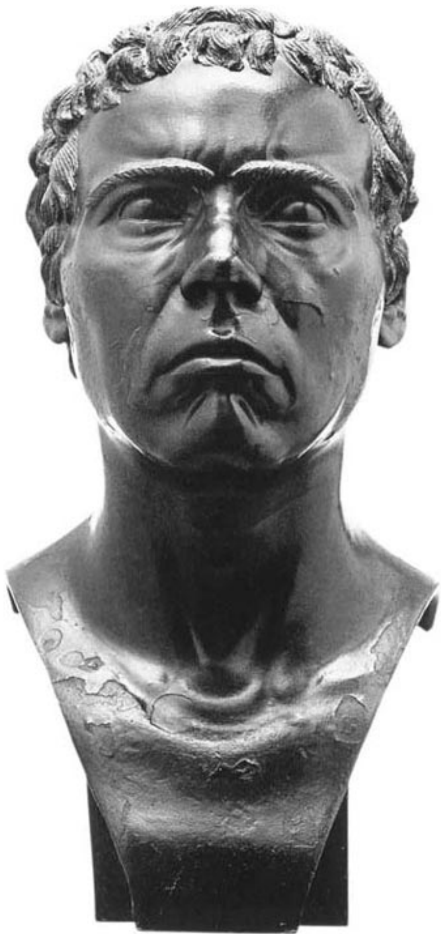
Franz Xaver Messerschmidt Der Melancholikus, nach 1770