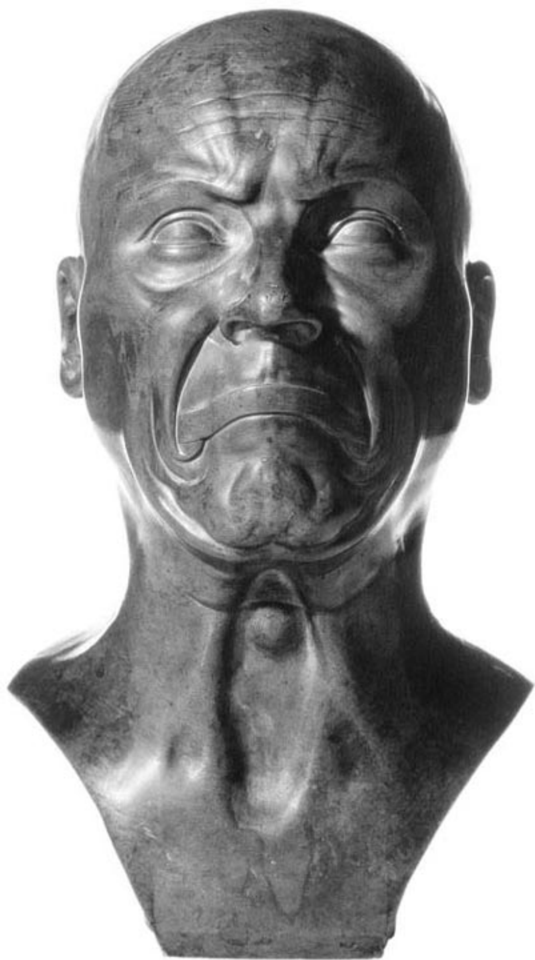
Franz Xaver Messerschmidt Innerlich verschlossener Gram, nach 1770