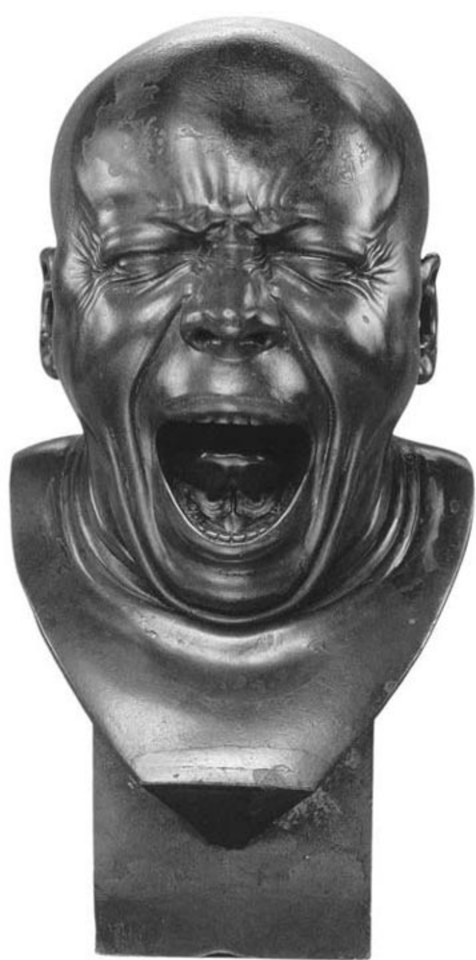
Franz Xaver Messerschmidt, Der Gähner, nach 1770