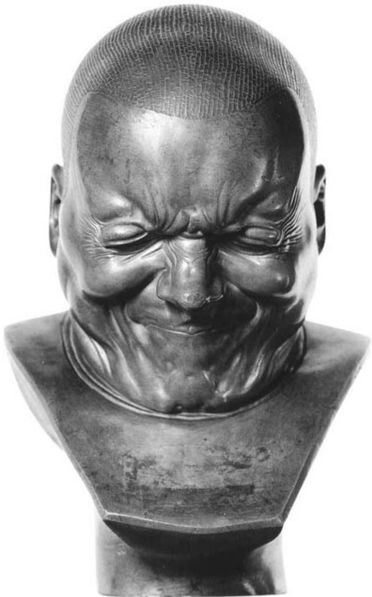
Franz Xaver Messerschmidt Ein Erzbösewicht, nach 1770