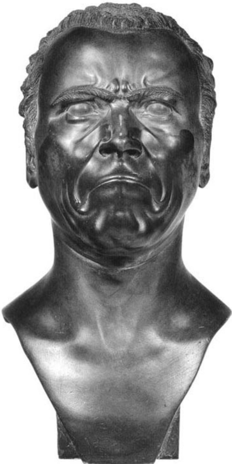
Franz Xaver Messerschmidt Ein mürrischer alter Soldat, 1777-1781