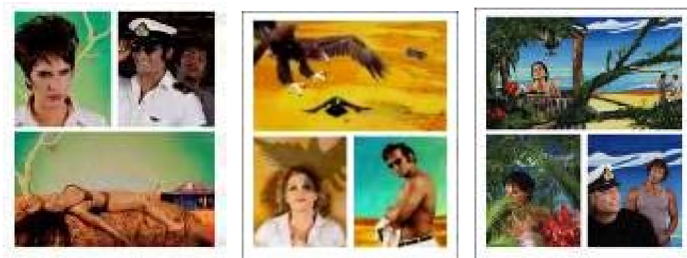
Tracey Moffatt, Adventure Series (10-teilig), 2004