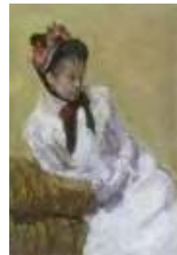
Mary Cassatt Selbstporträt, 1878