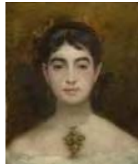
Marie Bracquemond Selbstporträt, um 1870