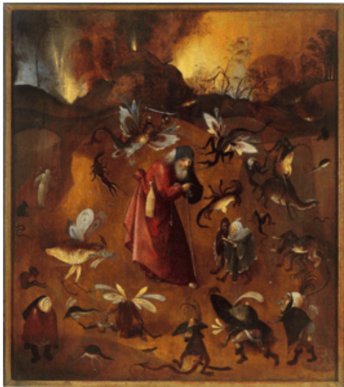
Hieronymus Bosch Nachfolger, Antonius mit den Monstern (um 1515)