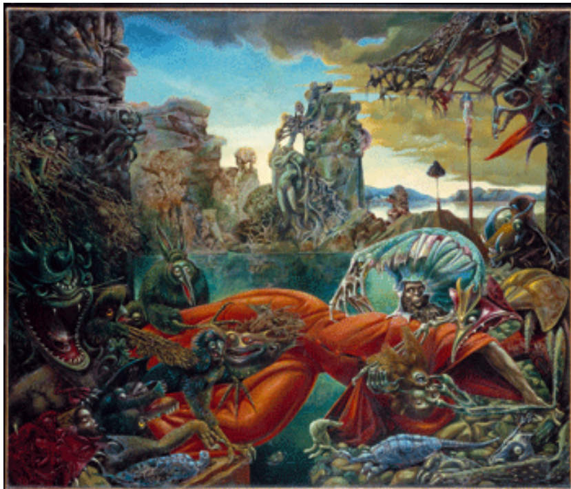
Max Ernst, Die Versuchung des heiligen Antonius, 1945