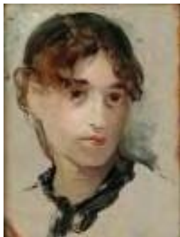
Eva Gonzalès Selbstporträt, o.J.