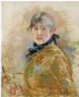
Berthe Morisot Selbstporträt, 1885