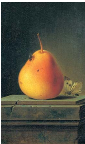
Justus Juncker, Stilleben mit Birne und Insekten (Detail), 1765, Städel Museum, Frankfurt am Main