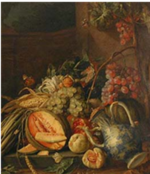
Cornelis de Heem, Gemüse und Früchte vor einer Gartenbalustrade (Detail), 1658, Städel Museum, Frankfurt am Main, Foto: Rühl und Bormann