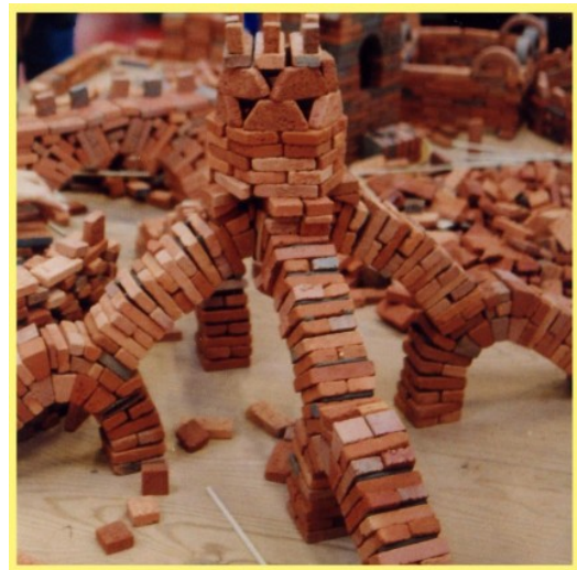
Bauwerke aus kleinen Ton-Bausteinen aufgeschichtet