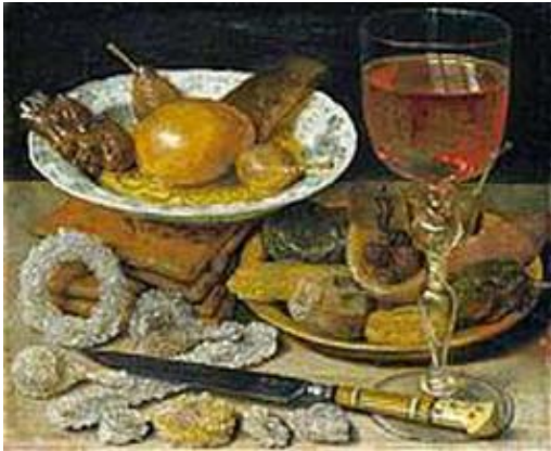
Georg Flegel, Stilleben mit Obst und Zuckerwerk, Städel Museum, Frankfurt am Main, Foto: Artothek