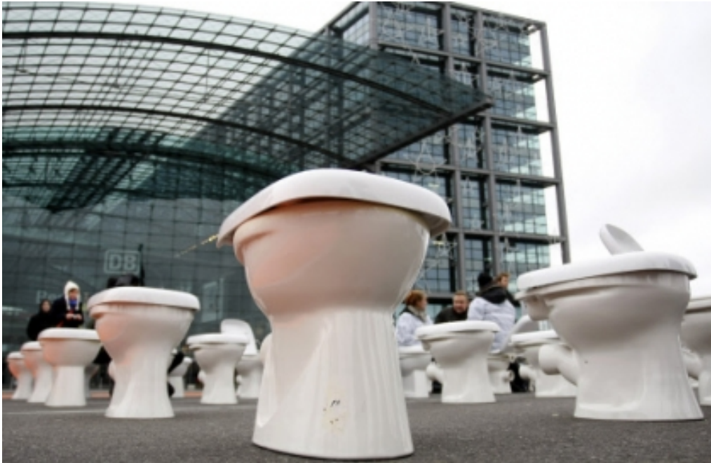
Abb.: Toiletten vor dem Berliner Hauptbahnhof am World Toilet Day 2008