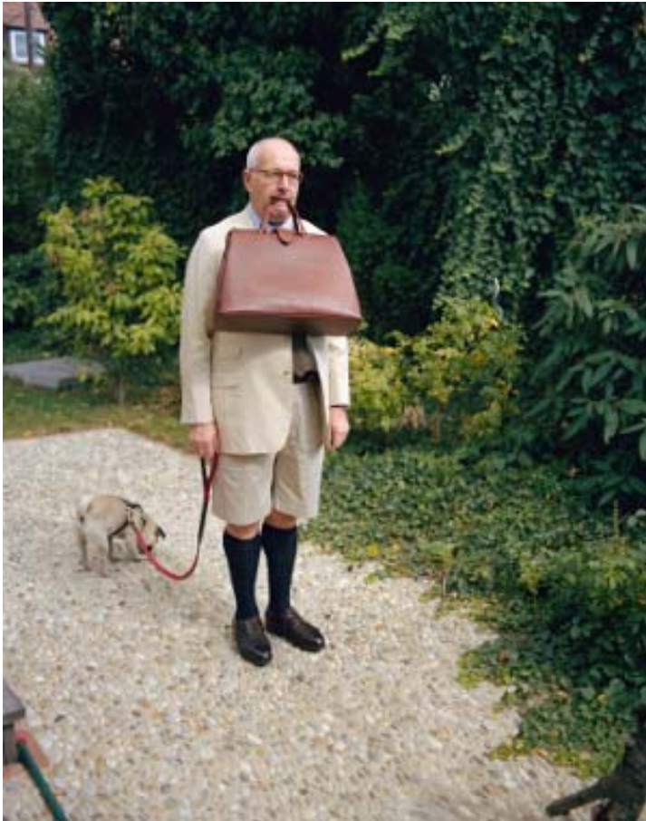
Abb.: Erwin Wurm: Der Taschenfabrikant, 2008