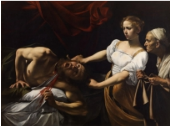
Abb. Caravaggio: Judith und Holofernes, 1597-1600 (Rom, Palazzo Barberini)