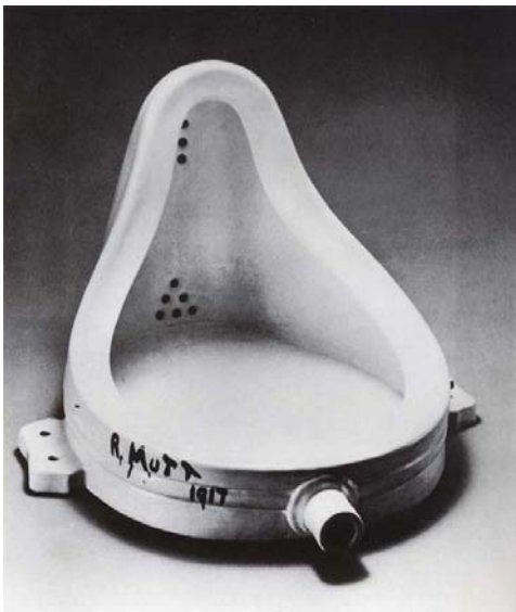
Abb.: Marcel Duchamp: Springbrunnen, 1917/Replik 1964