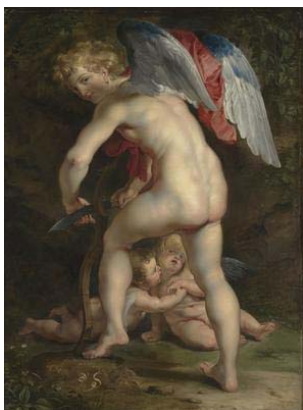
Abb.: Peter Paul Rubens: Armor schnitzt den Bogen, 1614