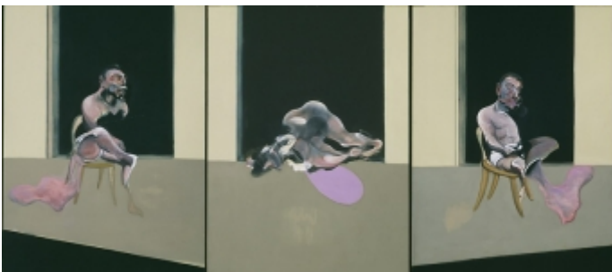
Abb. Francis Bacon: Triptychon August 1972, 1972 (London, Tate Gallery)