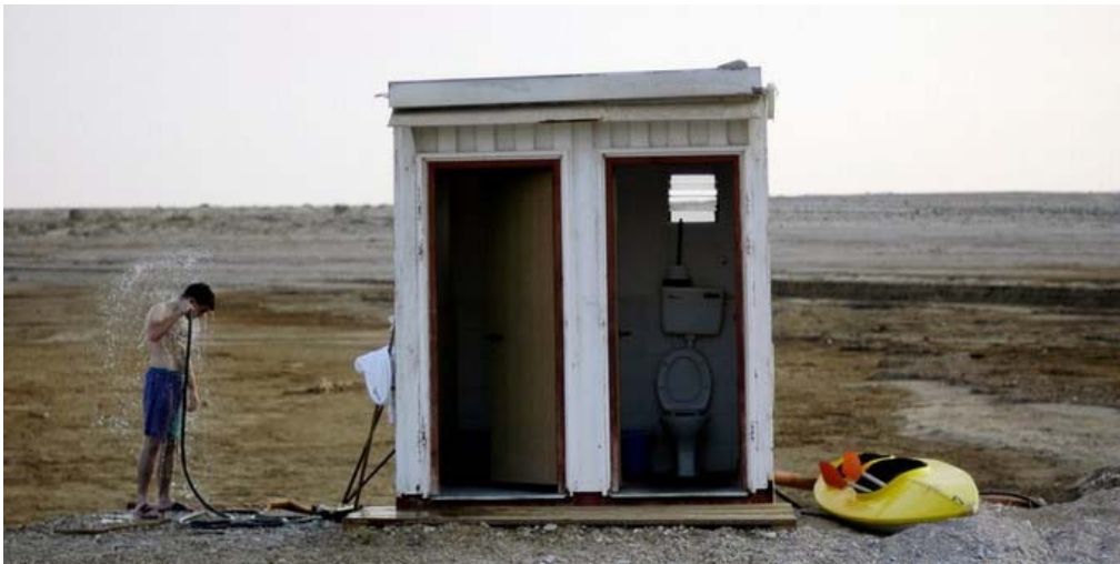
Abb.: Alles sauber?