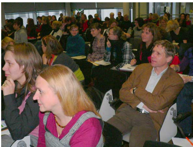
Abb. 2) Publikum der Tagung „Gestalten und Bilden“